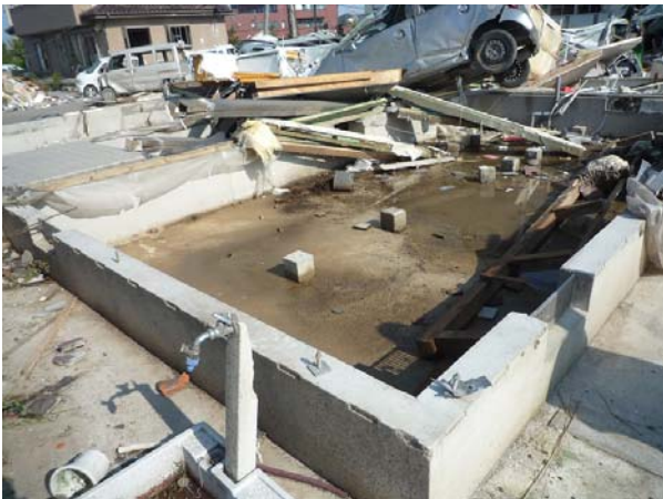
写真 5 木造建築物 D

上部構造全体が飛散した建築物 (木造建築物 D および E) がみられた。木造建築物 D (写真 5) では一部土台を残す (写真 6) もの、ほとんどの上部構造が飛散しているのに対し、木造建築物 E (写真 7) では、床板より上の部分が飛散している。