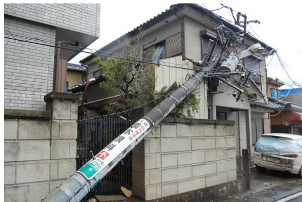
写真 34 電柱の折損・傾斜 2