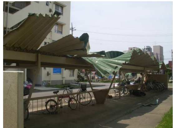
写真 31 駐輪場の折板屋根の著しい変形