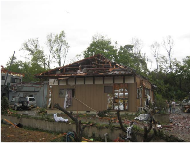
写真 11 木造建築物 I