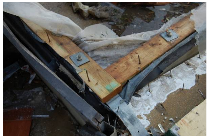
写真 6 木造建築物 D の土台 (土台は残存している)