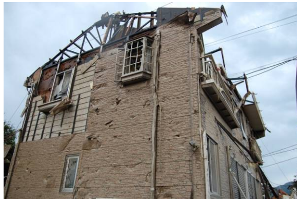
写真 17 鉄骨造建築物A