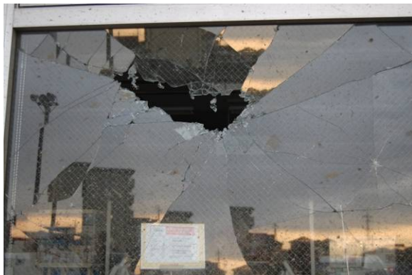
写真 25 窓ガラスへの衝突痕

竜巻通過時に発生する多数の飛来物による外装仕上げ材や開口部の被害も多数確認された。写真 25～26 はショッピングセンターのエントランスでの衝突痕、写真 27～28 は飛来した屋根ふき材または屋根の衝突、写真 29 は飛来した屋根ふき材が電線に引っ掛かった事例である。