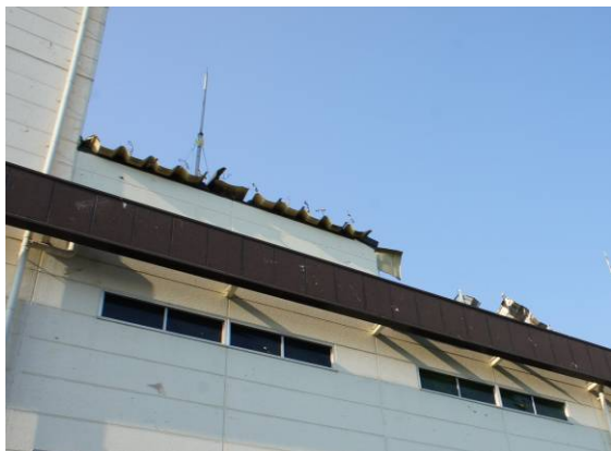
写真 41 屋根ふき材の損傷

鉄骨造建築物の屋根ふき材等の損傷が確認された。屋根ふき材の折板のなかには、通りを挟んで向かいの工場の敷地まで数十メートル以上飛散したものもあった。