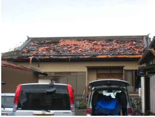
写真 15 木造建築物M