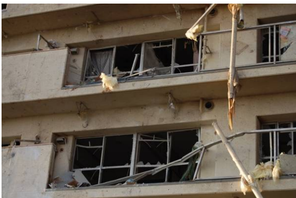
写真 22 窓とベランダ手すりの損壊 1