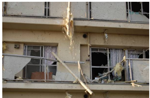
写真 23 窓とベランダ手すりの損壊 2