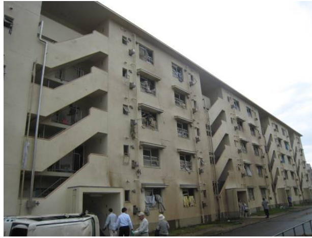
写真 24 集合住宅の北面の状況