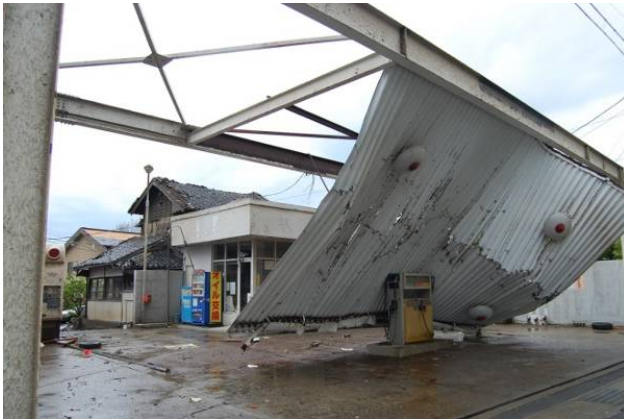
写真 30 ガソリンスタンドの折板屋根の脱落

4.4 節までに掲げた以外の被害事例を以下に示す。写真 30～31 はガソリンスタンドおよび駐輪場での屋根の脱落等、写真 32 はブロック塀の倒壊、写真 33～34 は電柱の折損、写真 35 は樹木の折損、写真 36～37 は乗用車の横転等の被害である。写真 33 は複数の電柱が連続して折損または傾斜している状況、写真 34 は折損した電柱が隣接する住家に倒れかかっている状況である。また、軽自動車以外の比較的重量のある乗用車やトラックも横転する事例がみられた (写真 37)。