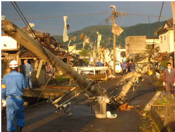
写真 33 電柱の折損・傾斜 1