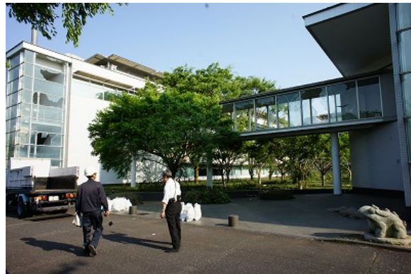
写真 38 渡り廊下のガラスの損傷