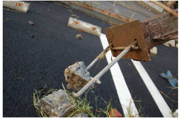
写真 20 写真 19 の柱脚の引き抜け状況