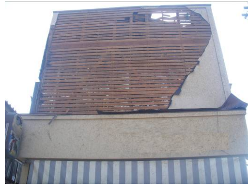
写真 16 木造建築物N