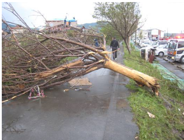
写真 35 樹木の折損