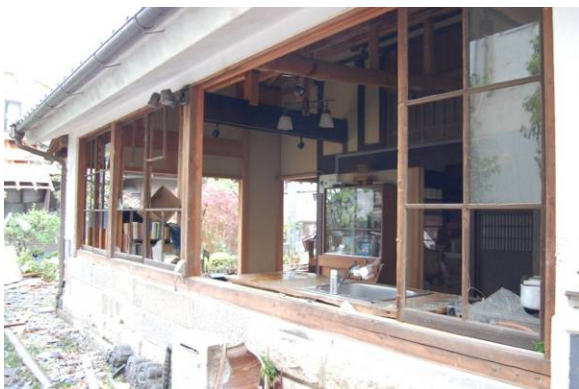
写真 13 木造建築物 K

面外風圧力によって開口部が破損した場合（写真 13、14）は、概して当該外壁構面の開口部全てが破損に至っている場合が多く、飛来物の衝突による場合は、局所的な開口部の破損にとどまると考えられる。