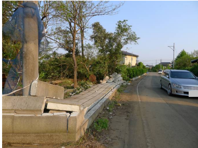
写真 32 石塀の倒壊