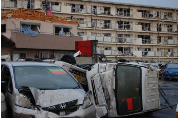
写真 36 乗用車の横転等