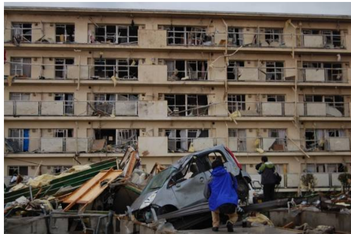
写真 21 集合住宅の南面の状況

5階建て集合住宅の南側の窓ガラス、サッシの枠、ベランダの手すり等が損壊した。開口の面積が小さいものの、北側でも同様に損壊がみられた。