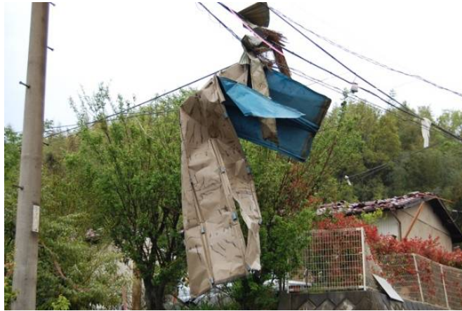
写真 29 電線に引っ掛かった飛来物(鋼板製屋根材)