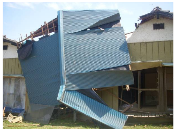
写真 28 飛来物(屋根)の衝突