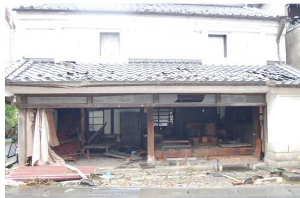
写真 14 木造建築物 L