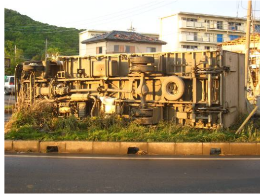
写真 37 トラックの横転