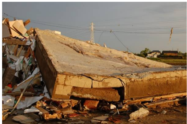
写真2 木造建築物Aのべた基礎底面の露出