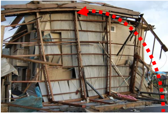
写真 19 鉄骨造建築物 C