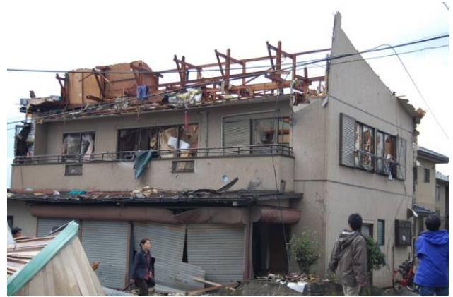
写真 12 木造建築物 J