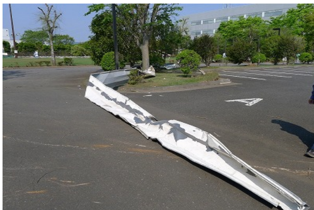
写真 42 飛散した折板