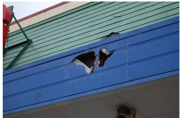
写真 26 外装仕上げ材への衝突痕