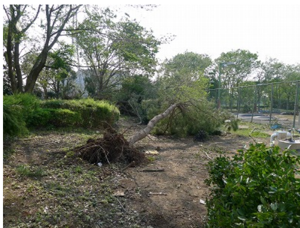
写真 43 根こそぎ倒れた樹木