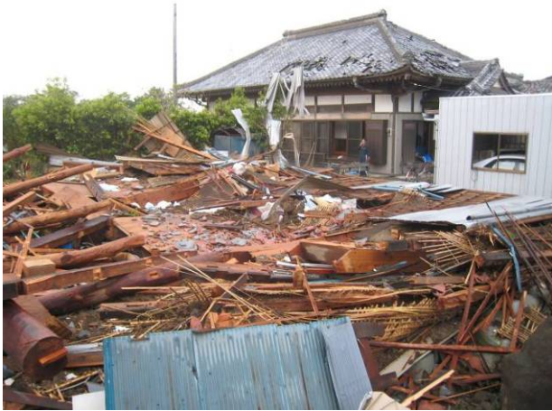
写真 3 木造建築物 B (手前の倒壊した建築物)

倒壊した建築物の構造仕様の詳細は正確には把握できないが、木造建築物 B (写真 3 の手前) や C (写真 4) では、竜巻による風圧力が建築物が保有する耐力を上回り層崩壊したと考えられる。