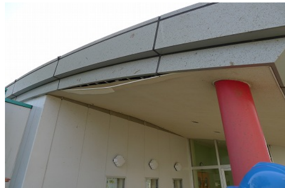
写真 40 軒天井の損傷