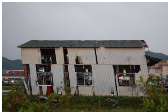
写真 18 鉄骨造建築物B