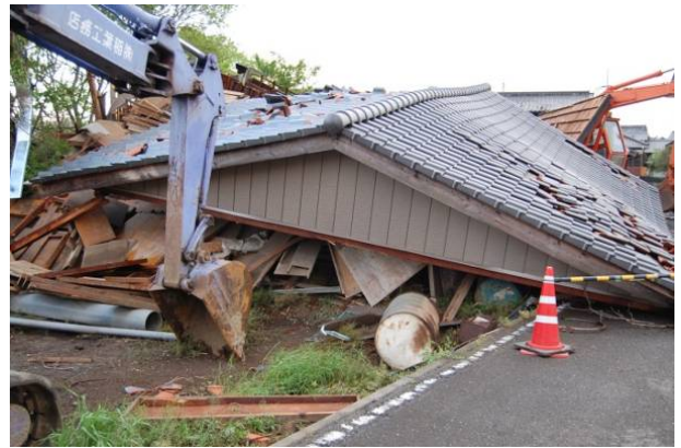
写真 4 木造建築物 C