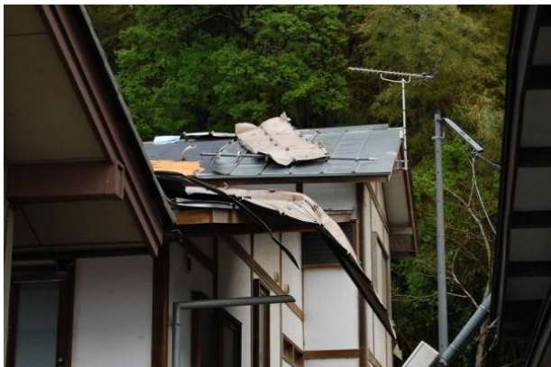
写真 27 飛来物(鋼板製屋根材)の衝突