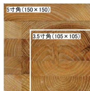
3.5 寸角に比べ約 2 倍の断面積