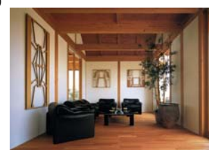
木組み現しの内観