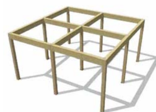
5寸柱によるメインフレーム