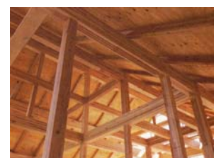
大きな断面の木組