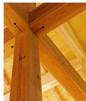
断面欠損の少ない金物接合