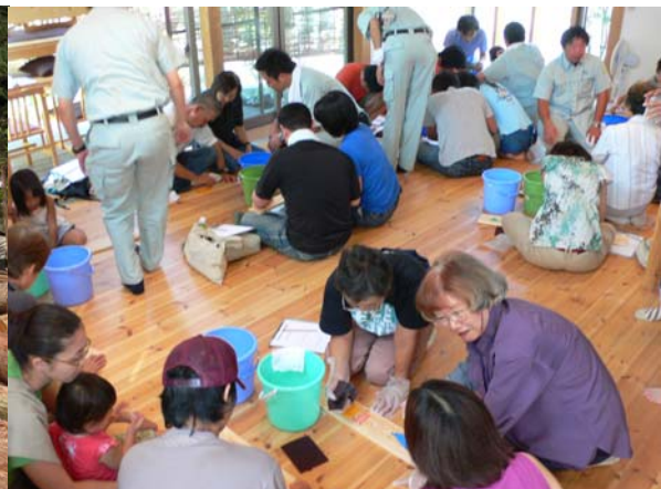
床のお手入れ講習会

家をしっかりつくり、愛着を持ってお手入れして、永く快適に住み続けられるシステムです。