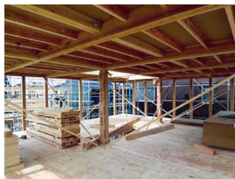
内部は2本の構造柱だけのがらんだ空間