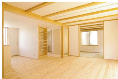
室内空間では建具や間仕切壁を簡単に変更できる