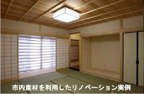
市内産材を利用したリノベーション事例

また、本工事の家屋解体工事時において、既存家屋で使用されていた良質な建材を一時的に保存し、改修工事時に化粧材等として再利用する。また、弊社が保管している他現場の解体時に発生した良質な建材についても、施主の希望があれば原則無料提供し、本工事において化粧材等に再利用する。廃棄物削減による低炭素化への貢献活動となる。