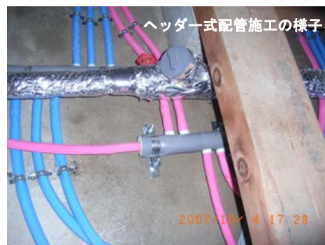
ヘッダー式配管施工の様子

床下の給排水配管およびガス管はコンクリートに埋め込まず露出配管とし、給水にはヘッダー式配管システムを採用する。水まわりには点検口を設け、さらに基礎部には人通口を確保し、点検やメンテナンスをしやすいとする。