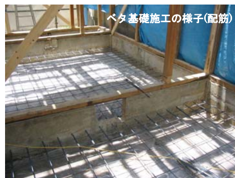
ベタ基礎施工の様子(配筋)

既存建物の基礎は布基礎あるいは礎石による独立基礎である場合が多いため、新たに防湿シートを施工した上で、鉄筋入りベタ基礎に変更する。柱等の軸組みは腐食部分を入れ替え、必要に応じて補強し、薬剤散布による防蟻工事を行う。また、構造計算により耐力壁を追加する。外壁はできるかぎり通気工法にて施工し、雨水の浸入を防ぐ。屋根には軽量の屋根材を使用する。これらにより、耐久性能および耐震性能を向上させる。