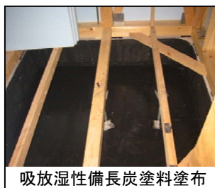
吸放湿性備長炭塗料塗布