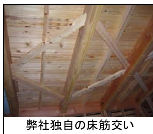
弊社独自の床筋交い