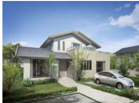
シンセ・ソレスト

トヨタホームは、高い耐久性とともに耐震性や可変性・省エネ性を兼ね備えた『長く住める家』。更に街の景観デザインや外構、生活に欠かせない車の将来像をも踏まえ、世代を超えて住み継がれる住まいを提案。その性能を長く保つためには、住む人が維持管理し易い仕組みの整備・提供が不可欠であり、「トヨタホーム・シンセ」「トヨタホーム・エスパシオ」で運用される、 生涯サポート「アトリスプラン」 を中心とする維持管理・流通強化を提案コンセプトとした。