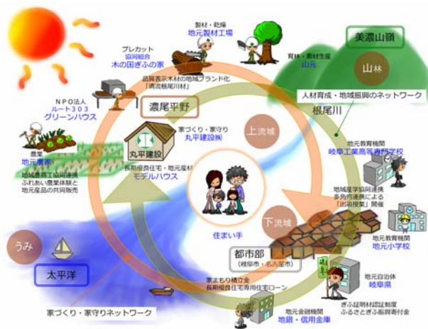
川上・川下の地域一体型ネットワーク

当地域においては歴史的に、川の水運を用いた木材運搬が盛んで、流域には木材業・木材加工業が発達してきた。弊社もそうした環境の中、創業以来 根尾川流域で一貫して実績を積み重ねてきた地域に根差した事業者である。