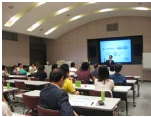
長期優良住宅セミナー

弊社では住まい手に対する「長期優良住宅セミナー」の定時開催のほか、さまざまな普及啓発の取り組みを実施し、この地域の長期優良住宅と地域循環型社会形成への取り組みをリードしている。