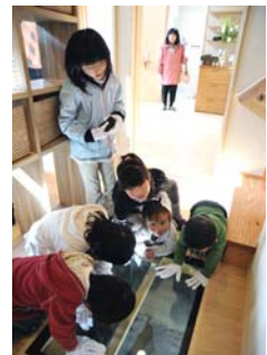
長期優良住宅モデルハウス見学会

住まい手や近隣からの評価も非常に高い安心の長期優良住宅を今後もこの地域で根付かせてきたい。