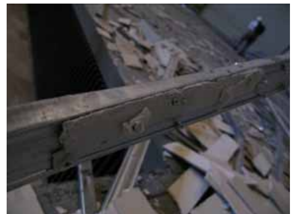
図-4.44 脱落したダブル野縁