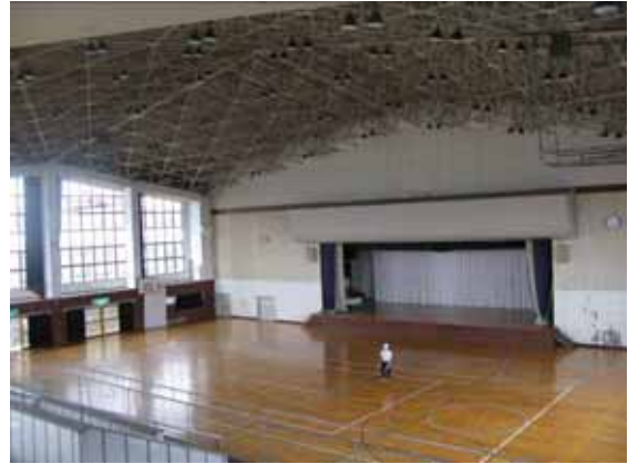
図-4.13 建物C 内観（左側が北側妻面）