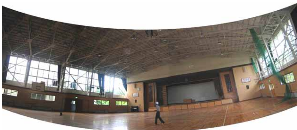
図-4.7 建物 B 内観 (パノラマ合成)