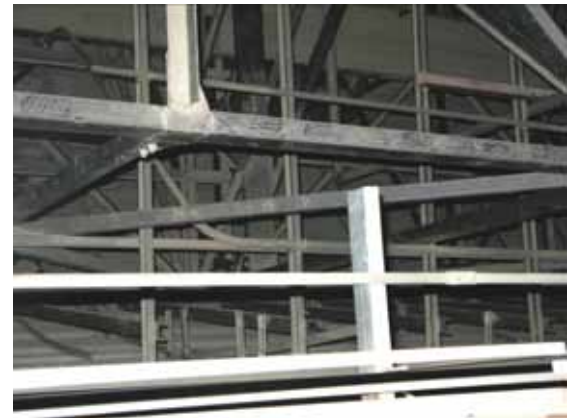
図-4.40 上部から曲面状仕上げ部分を見下げ