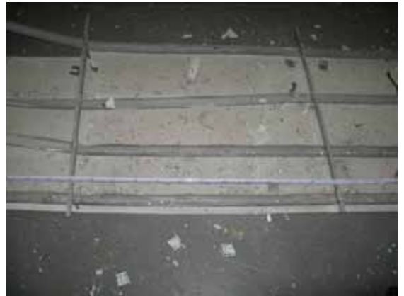
図-4.42 脱落した天井板とダブル野縁