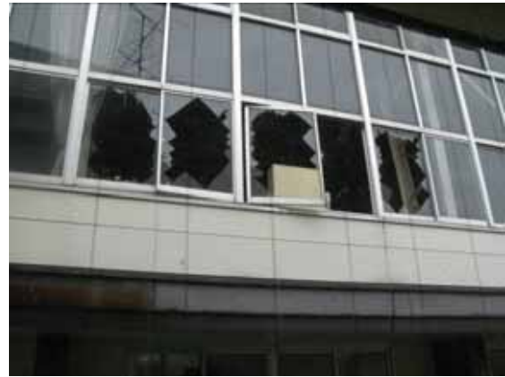
図-4.9 ガラスの破損、障子の脱落（南西側）