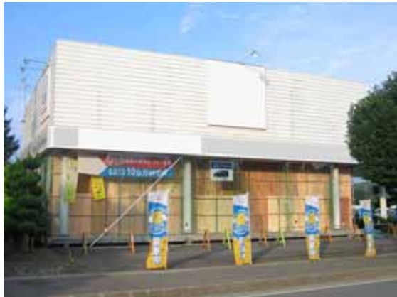
図-4.46 建物 H 外観