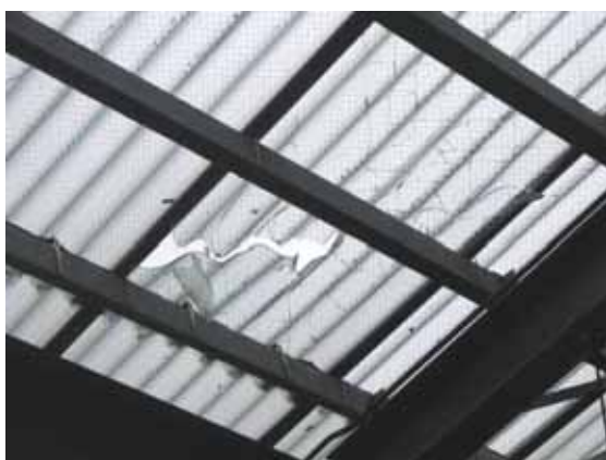
図-4.27 破損したガラス