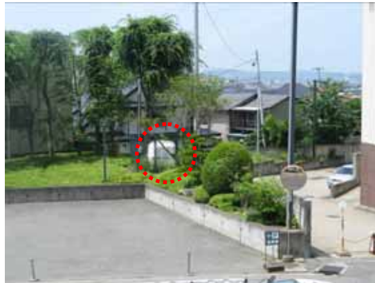
図-4.50 K-NET 八戸（右側が建物 F）