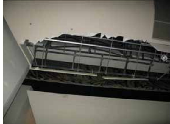
図-4.38 同部の舞台左側の損傷箇所