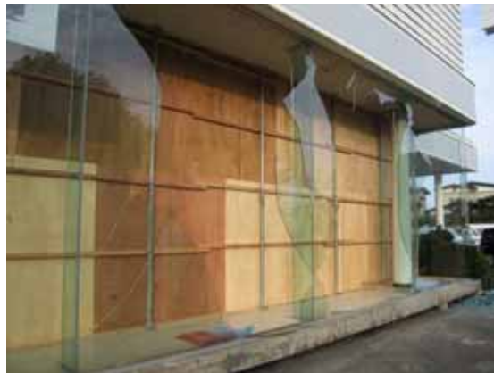
図-4.47 被害のあったガラス箇所