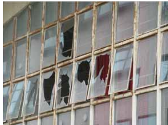
図-4.19 北側妻面の窓ガラスの損傷