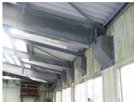
図-4.28 屋根大梁端部(突出部の鋼板は改修時のもの)