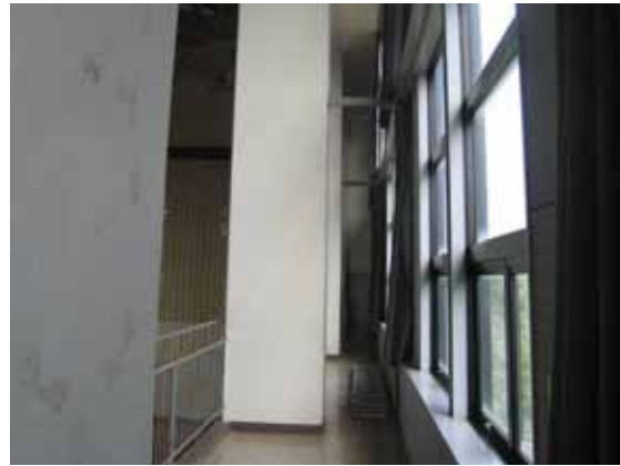
図-4.21 南側妻面のサッシ面を横側から通して見る