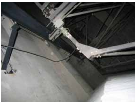
図-4.35 同骨組みとガイドレール取り付け