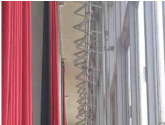
図-4.20 北側妻面のサッシ面を横側から通して見る