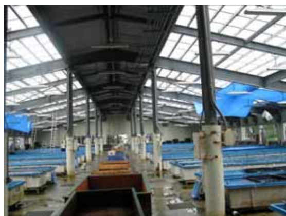
図-4.26 建物 E 内観