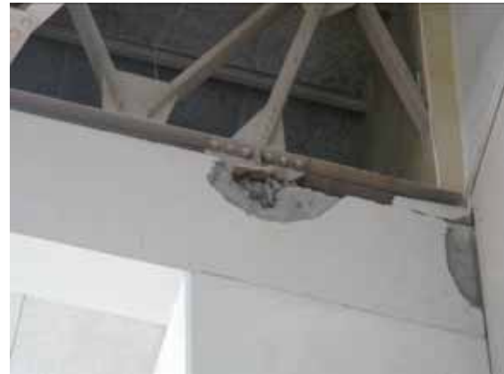
図-4.17 屋根支承部の損傷