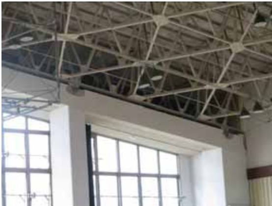
図-4.16 屋根支承部の損傷