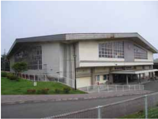
図-4.12 建物C 外観（北西より）