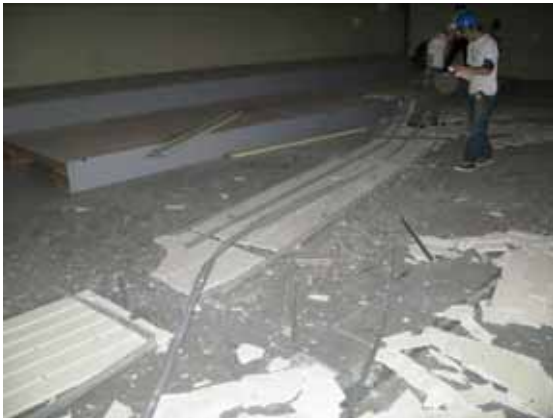
図-4.41 一体で脱落した天井板とダブル野縁