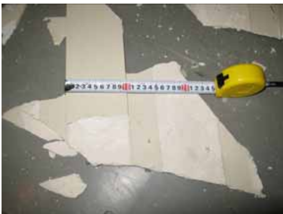
図-4.43 脱落した天井板