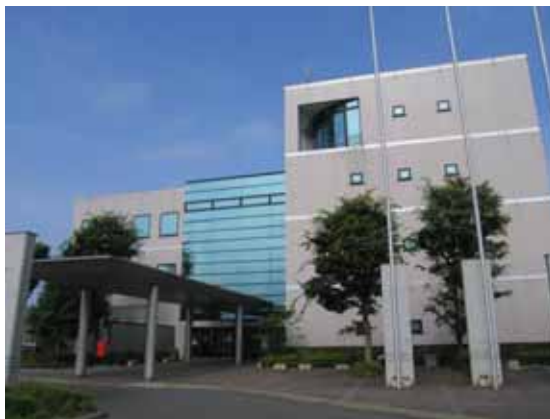
図-4.45 建物 G 外観