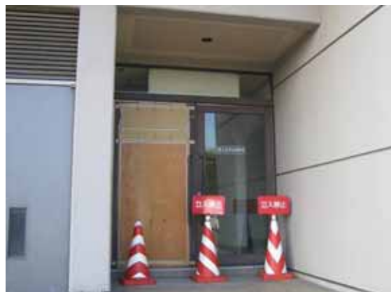
図-4.24 非常口の網入りガラスの破損