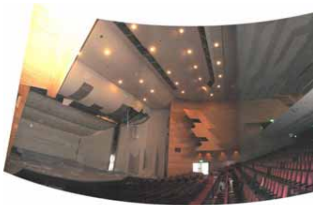
図-4.30 建物 F ホール内観（パノラマ合成）