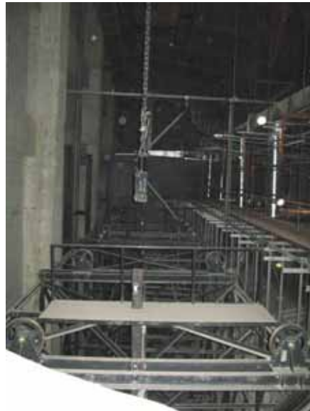
図-4.34 同上部の吊り状況