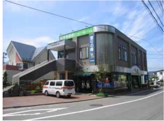
図-4.49 脱落箇所と逆側の面