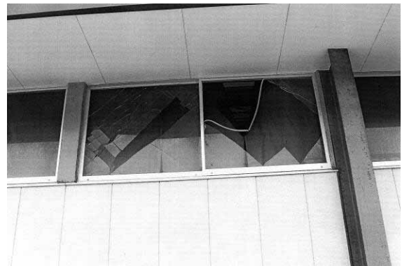
図-4.2 破損した窓ガラス