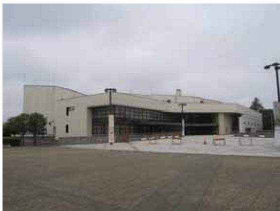
図-4.29 建物 F 外観