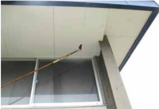
図-4.3 破損した軒天井