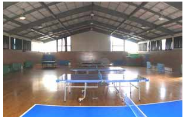
図-4.4 建物A内観(パノラマ合成)