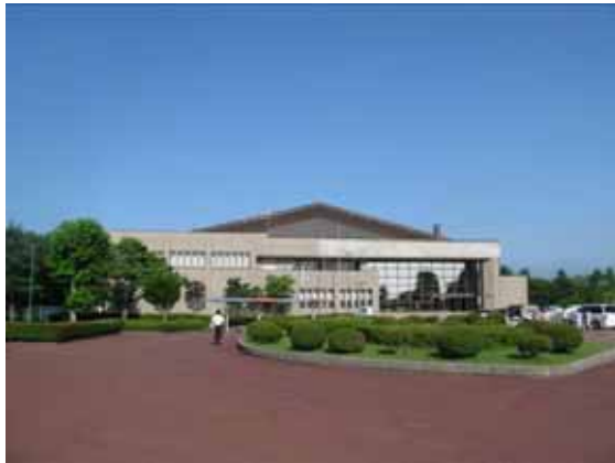
図-4.22 建物D外観(右側に入口)