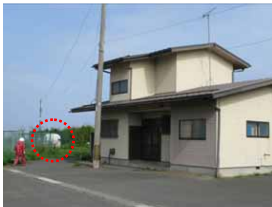
図-4.51 K-NET 種市