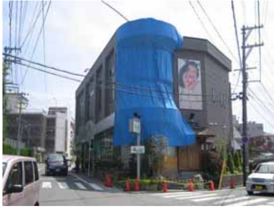
図-4.48 ガラスブロックが脱落した箇所