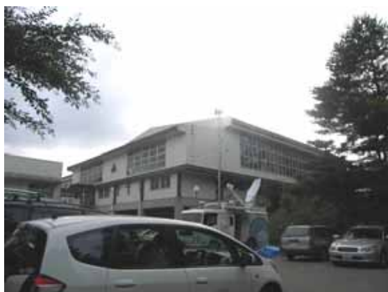
図-4.5 建物 B 外観 (東側より)