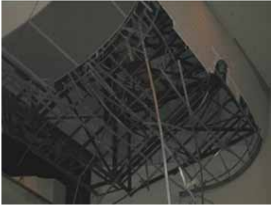
図-4.37 同部の舞台右側の損傷箇所