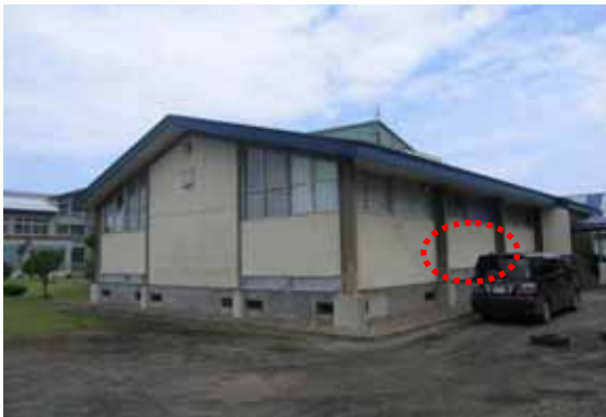
図-4.1 建物A外観(赤楕円箇所が損傷箇所)