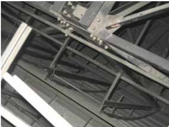
図-4.39 上部から曲面状仕上げ部分を見下げ