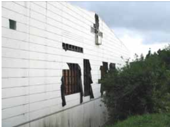
図-4.10 妻面（舞台裏）の外装材の損傷