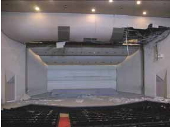
図-4.31 客席から舞台方向を見る