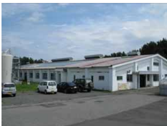
図-4.25 建物 E 外観