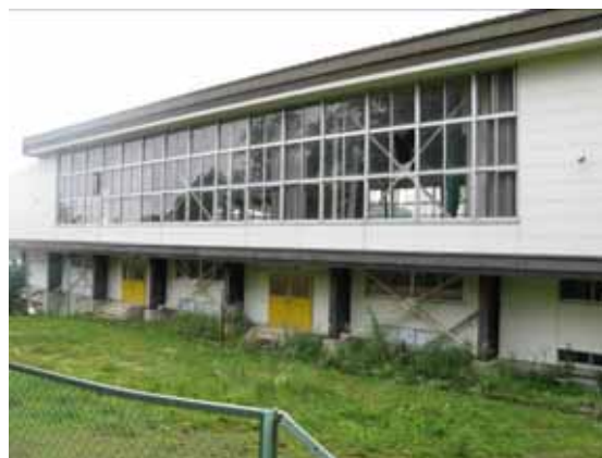
図-4.6 建物 B 外観 (北東側)