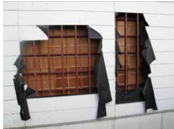
図-4.11 外装材損傷箇所