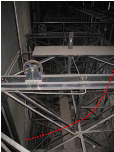
図-4.33 プロセニウムブリッジ上部（赤点線が断面形状）