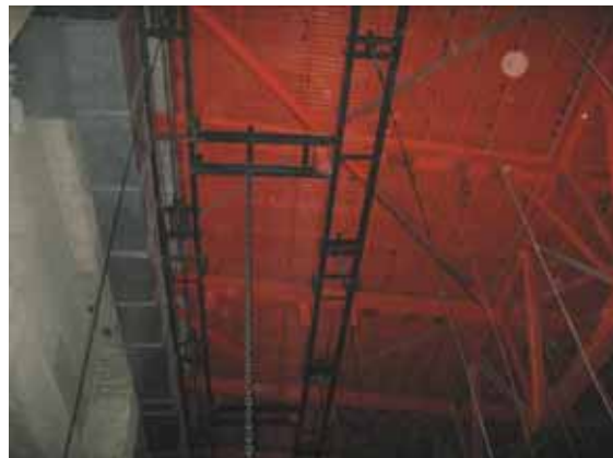
図-4.36 同上部の屋根面