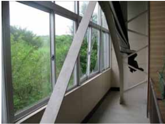
図-4.8 ブレースの座屈とガラスの破損