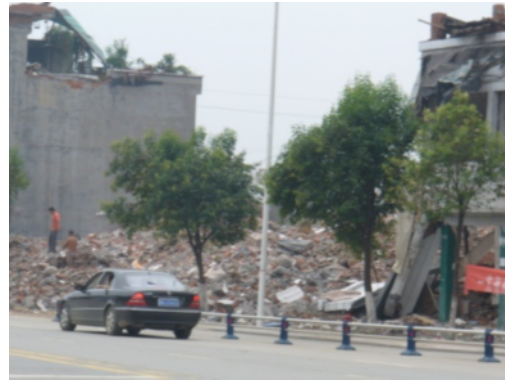
写真8 崩壊した建築物の残骸 めんちく かんおう (綿竹市漢旺鎮)