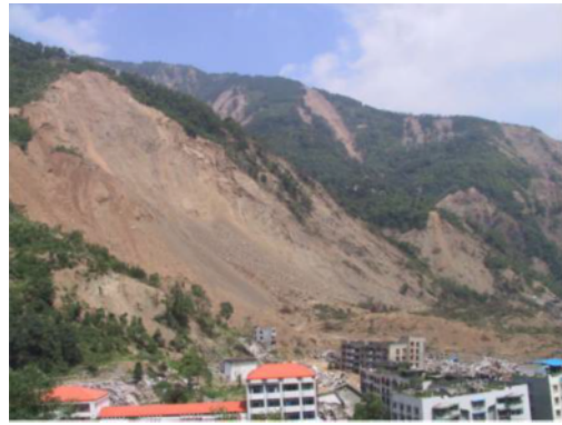
写真2 大規模な土砂崩落 (北川羌族自治州曲山鎮)