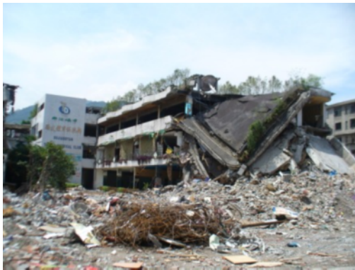
写真5 都市部の中層建築物の層崩壊 (都江堰市街地)