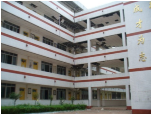
写真9 学校建築の天井脱落等 (綿竹市市街地)