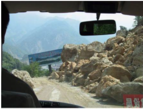
写真1 落石による道路損傷 (北川県入口)