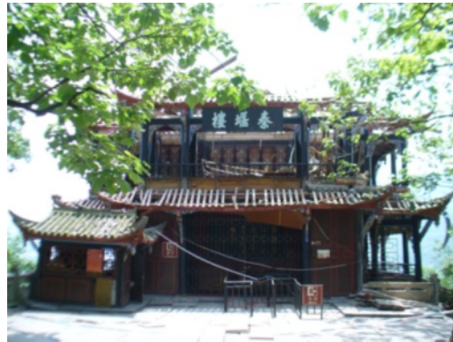
写真6 歴史的建築物の屋根瓦の脱落等 (都江堰市)