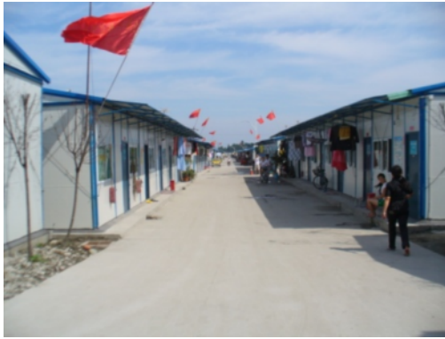
写真7 仮設住宅 (都江堰市郊外)