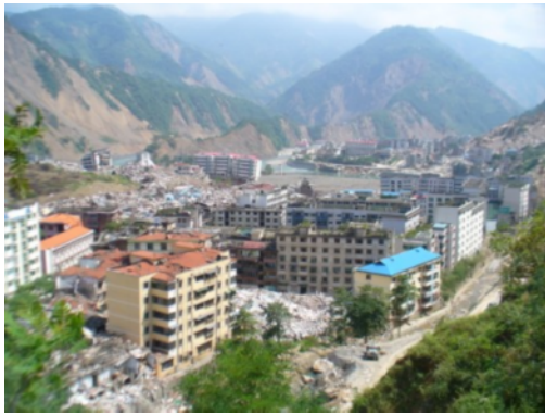
写真3 曲山鎮の全景