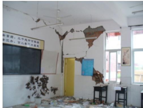
写真10 学校教室内の組積造壁の脱落 (綿竹市市街地)