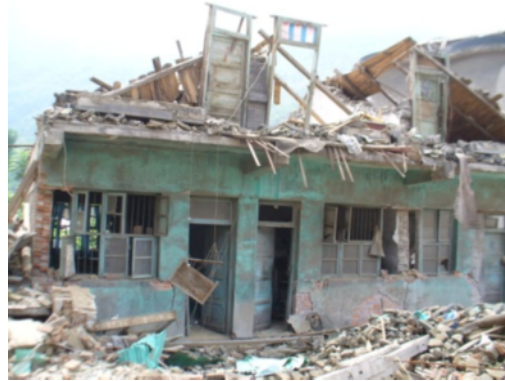
写真4 農村住宅の層崩壊 (安県擂鼓鎮)