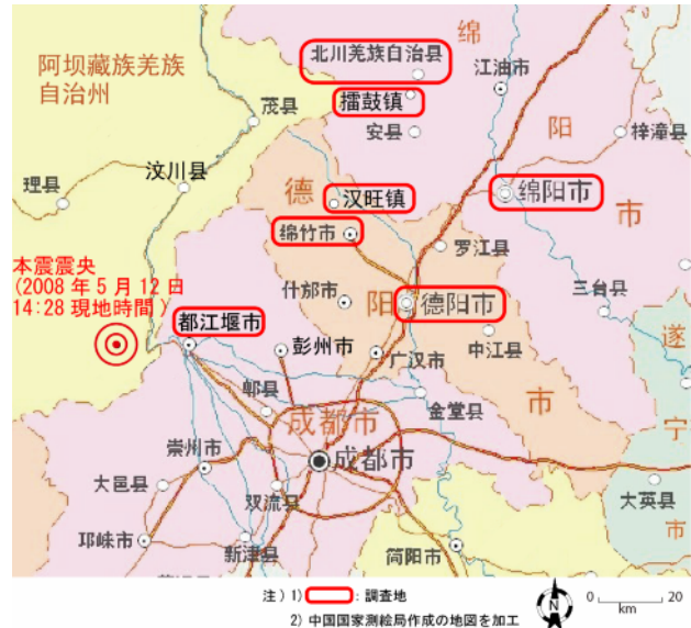
図2 中国四川省成都市周辺と調査地

今回の断層は、断層破壊面を境に、上側にある汶川県側の大陸プレート(インドプレート)が、下側にある成都市側の大陸プレート(ユーラシアプレート)に乗り上げた逆断層であり、ヒマラヤ山脈の一部の標高が数 cm 上昇したと言われている。逆断層が発生した場合、一般に、断層破壊面上側の大陸プレート上、及びその周辺において、地震被害が大きくなると言われている。