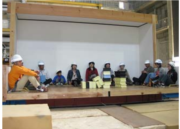
「超高層のゆれを体験してみよう」 地震のゆれを体験できる振動台にのって、超高層の地震のゆれを体験しました。