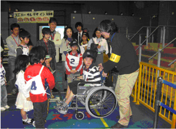
「身のまわりにあるバリアに気づいてみよう」 バリアフリーやユニバーサルデザインなど、安全安心を支える技術について体験しました。