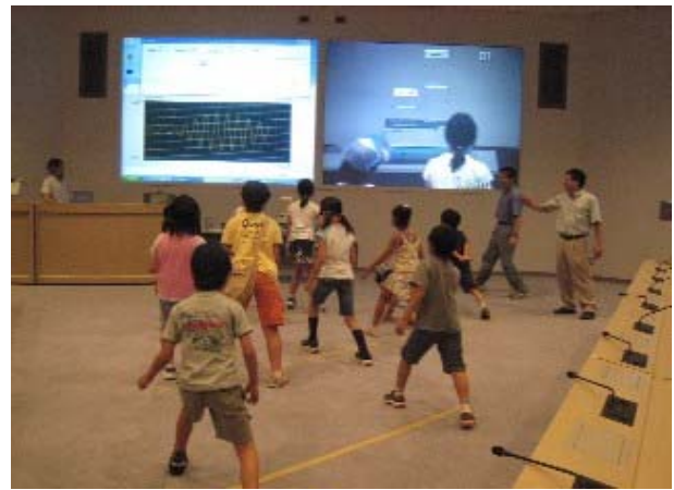
「建物のゆれを測ってみよう」 みんなで建物を揺すって、その揺れを測る体験をしました。