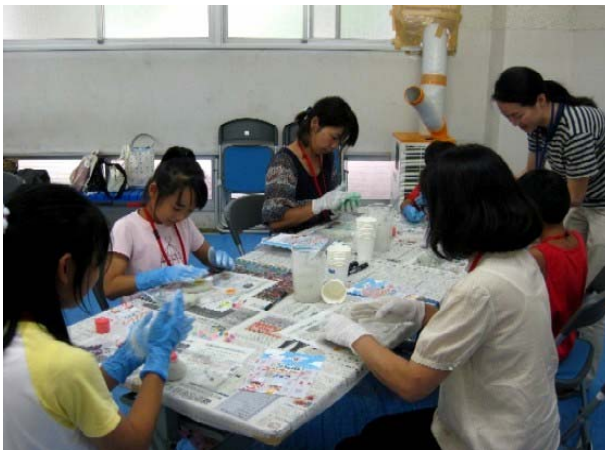
「オリジナル小物づくり大作戦」 セメントを使ってオリジナル小物づくりにチャレンジしました。