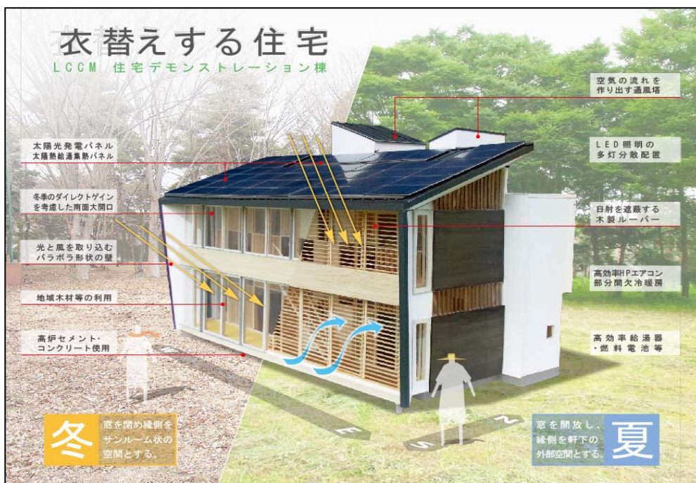
(図3) LCCM住宅デモンストレーション棟/衣替えする住宅