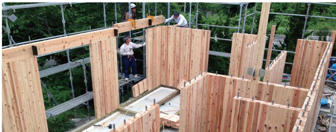
FSB工法建方時の写真