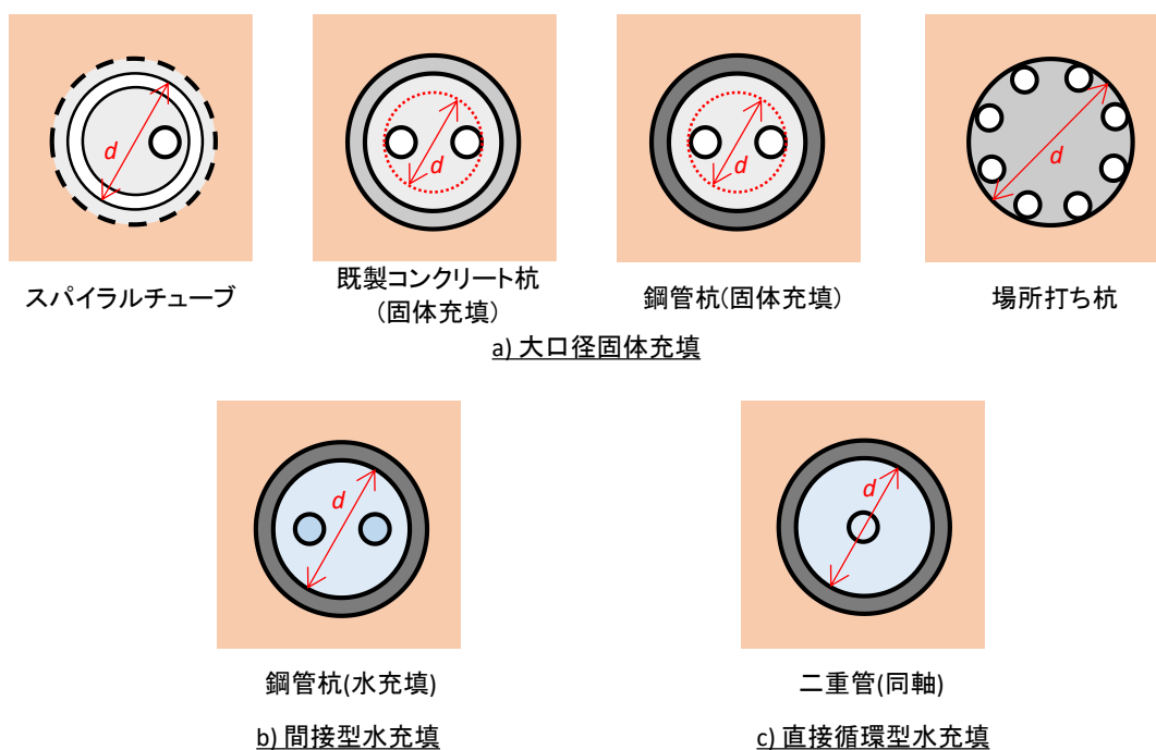
図 0.3 熱交換器の断面の直径に係る寸法 d_{exch,i} (特定非営利活動法人地中熱利用促進協会資料をもとに作成)

熱交換器の種類が直接循環型水充填の場合、循環用の液体を入れた管の内径(液体部分の直径)を熱交換器の断面の直径に係る寸法 d_{exch,i} とする。