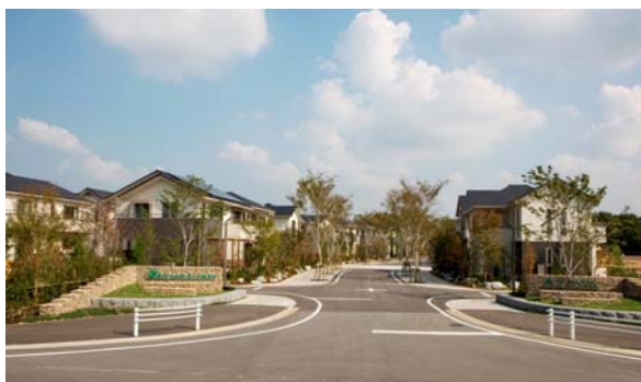
街なみのイメージ

本事業は愛知県日進市のほぼ中央に位置する丘陵地を、周辺環境に配慮して開発した全57区画の住宅地である。事業の基本コンセプトは「環境共生」「美しい街並み」「安全・安心」「コミュニティづくり」の4点であり、これらをベースに、住み続ける事でより成熟度を増していく、将来も色あせる事のない魅力と価値のある資産となる街づくりを目指す。