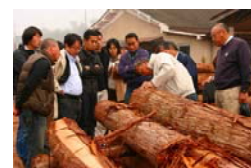
京都鴨川建築塾の様子