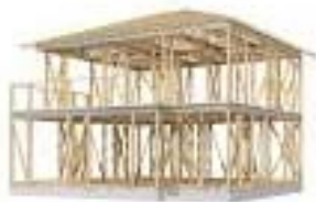
テクノストラクチャー工法