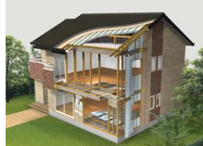
オリジナル高気密高断熱システム