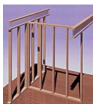
フリーウォールシステム

住宅の履歴情報となる「構造計算書」「構造設計図書」、「建築確認図書」、「性能評価書」さらに「UNIT配線（換気、情報配線）、配管図」等を「家歴書」として購入者に引渡します。また、これらの情報をデータベース化を行った上で管理し、リフォーム時に紛失していた場合には、再発行を行うことでリフォームしやすい仕組みを整え、リフォーム後は変更履歴を保管します。