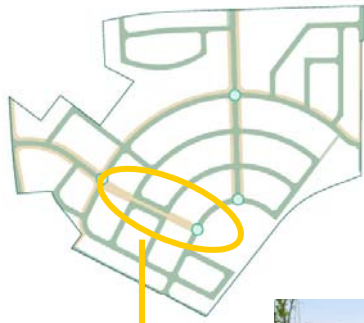
歩行者専用の道路 七色の小径(こみち)