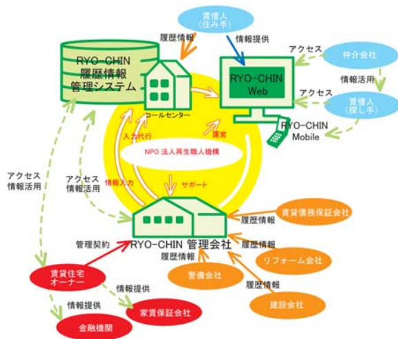
RYO-CHIN（良質賃貸住宅）ネットワークシステム関連図

住宅履歴情報を、建物の情報蓄積から不動産・管理情報の履歴を抱合した新しい履歴情報へと進化することが賃貸住宅の長期優良化の実現に貢献できると考えています。