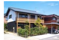
気候風土に適した住まい