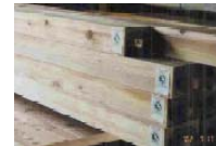
認証シール貼の越後杉ブランド材