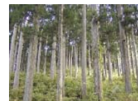
豊富な資源の杉人工林