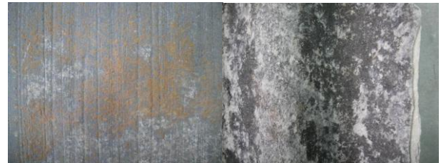
図1 アスベスト含有成形板の外観

す。付着状況の確認は、塗膜表面の観察及び JIS K 5400（塗料一般試験方法）を準用しカッターによる切り込みでセロハン粘着テープを貼付する方法により行った。この結果、表面劣化度及び下地調整毎に良好な塗装仕様が確認された。また、水系下塗り塗料は溶剤系下塗り塗料と比較して付着性が乏しい場合のあることが確認された。