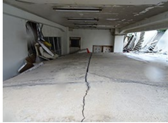
写真4-2 B建物1階床面の盛り上がり

○令和6年能登半島地震による 建築物の基礎・地盤被害に関する現地調査報告（速報） は、 建築研究所ホームページ及び国土技術政策総合研究所ホームページに掲載しています。