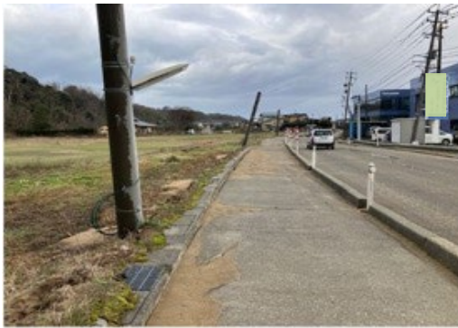
写真2-1 県道8号の様相(砂丘に隣接)