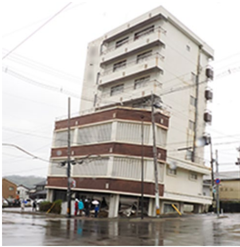
写真4-1 傾斜したB建物