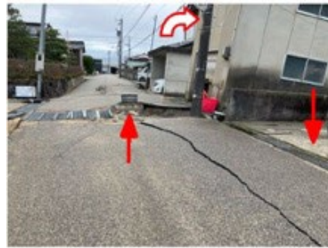
写真2-2 液状化による被害例